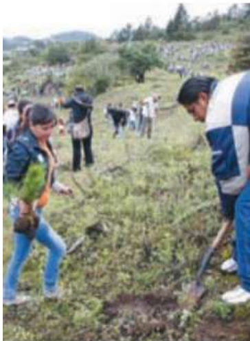
Figura 3.17. Las campañas de reforestación suelen incluir a los grupos más sensibles de la sociedad para generar respeto por el medio y resarcir los daños producidos al ambiente.

De acuerdo con el esquema de la figura 3.16 de la página 87, un desarrollo que toma en cuenta los aspectos económicos y sociales, y soslaya el aspecto ecológico, solo es equitativo, pero no es viable ni soportable. Si un proceso productivo afecta el ambiente de manera negativa, tendrá consecuencias significativas para el entorno social.