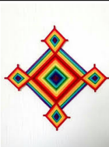
Ojo de dios